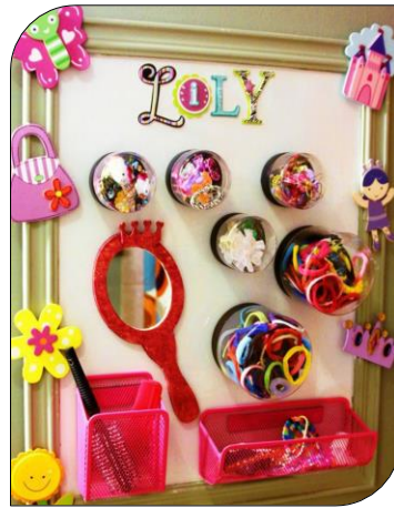
Çeşitli Malzemelerden Takılık